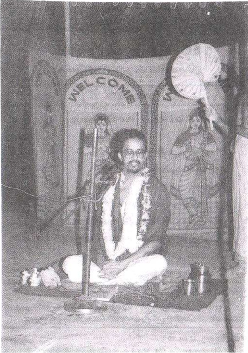
சென்னை ஆதம்பாக்கம் ஸ்ரீ சங்கர கேந்திரம் கைங்கர்ய ஸபாவில் உபன்யாஸம் நிகழ்த்தும் ஸ்ரீ குருஜி